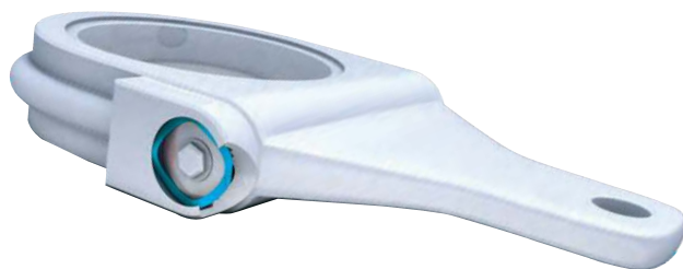
Gear Bracket Application